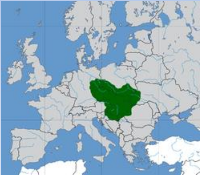
Велика Моравска у 9. веку