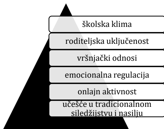
Slika 2. Najvažniji činioci digitalnog nasilja.

Sumiranjem rezultata navedenih istraživanja, najvažniji činioci za određenje sklonosti ka digitalnom nasilju ili viktimizaciji prikazani su na Slici 2.