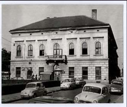
Hotel 'Srpska kruna' zgrada biblioteke od 1946. do 1947.

Godišnji izveštaji Narodne biblioteke Srbije o čitanosti knjiga su dragoceni izvori podataka. Prvi je objavljen 1895. godine u Godišnjaku Srpske kraljevske akademije . U njima se govori o broju čitalaca iz godine u godinu, ali i o njihovoj socijalnoj strukturi. Na osnovu tih podataka je moguće rekonstruisati društvenu pripadnost čitalaca, kao i dati prikaz kulturnih potreba. U posebnim rubrikama razvrstavane su knjige po žanrovima, naučna, zabavna literatura i to je omogućavalo da se prati čitanost domaće literature u odnosu na inostranu.