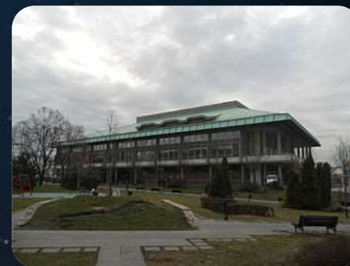
NARODNA BIBLIOTEKA SRBIJE